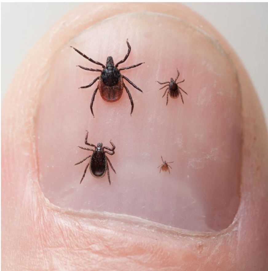
Vrouwtje, nimf, mannetje en larve van de schapentek. De nimf is verantwoordelijk voor de meeste gevallen van Lymeziekte.

In en om stallen kun je het beste laarzen dragen met niet te veel profiel. Deze kunnen goed worden schoongemaakt. Het is heel belangrijk dat er een laarzenborstel is, liefst met een kraan erbij, zodat alle mest goed kan worden afgeborsteld. Als er mest in het laarzenbad komt, werkt het ontsmettingsmiddel namelijk niet meer. Om de laarzen te ontsmetten, moeten ze minstens 10 minuten in een laarzenbad blijven staan, even erin en eruit stappen heeft geen zin. Het water in het bad moet regelmatig worden ververs.