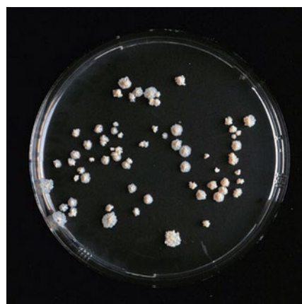
Bacteriën die rundertuberculose kunnen veroorzaken.